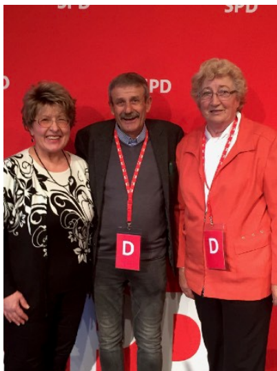
Brandenburger Delegierte auf der Bundeskonferenz 2017 in Wolfsburg (oben).